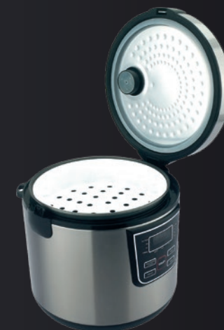
Estante de vapor