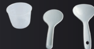
Rice spoon, Soup spoon and Measuring cup